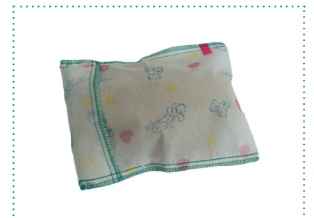
Einwegbezug Abdominal Pillow