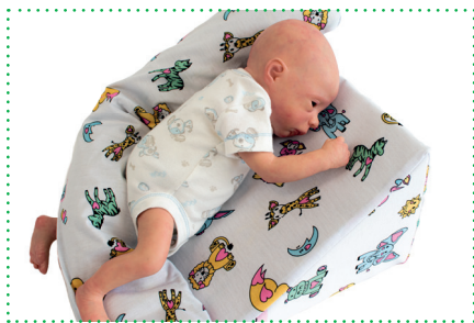
Reflux Wedge / Bed Buddy