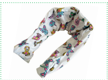
Baumwollbezug Bed Buddy Diana