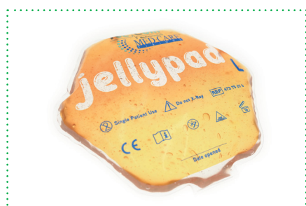
jellypad Größe L