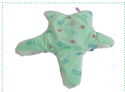
Einwegbezug Wonder Star