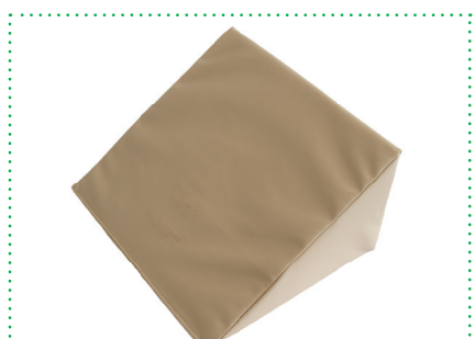
Lagerungshilfe Reflex Wedge