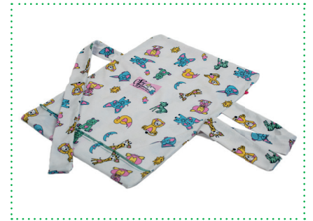
Baumwollbezug mit Bändchen