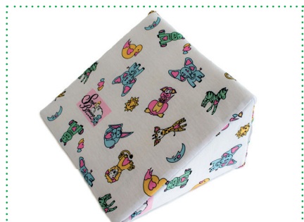
Baumwollbezug Reflex Wedge