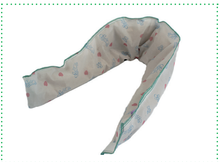
Einwegbezug Bed Buddy Diana