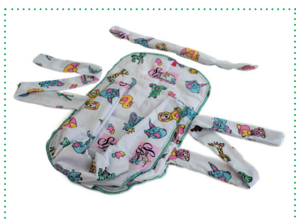
Baumwollbezug Cuddle Up Hug