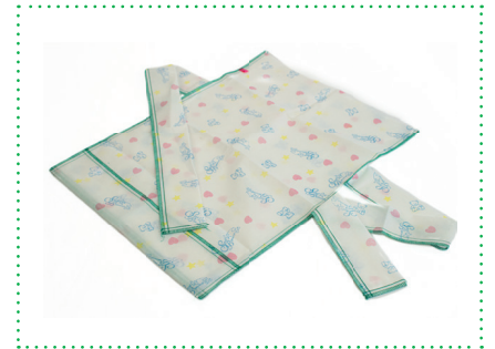
Einwegbezug mit Bändchen