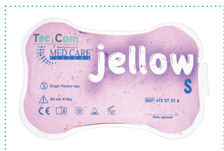
jellow Größe S