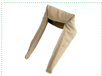
Lagerungshilfe / gepolsterte Fußrolle