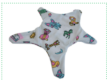
Baumwollbezug Wonder Star