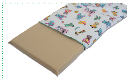
Heavenly Foam Mattress mit Baumwoll- bezug