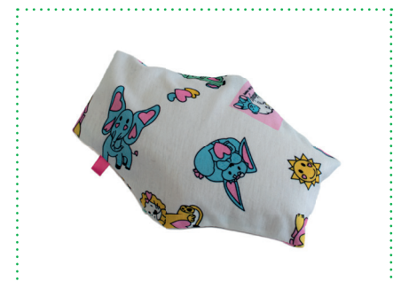
Baumwollbezug Abdominal Pillow