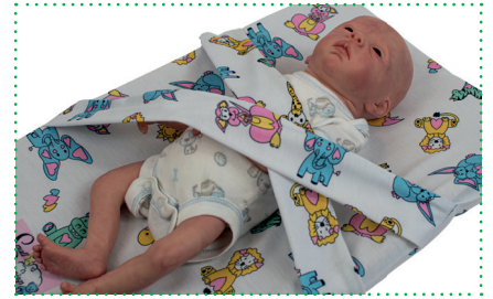
Heavenly Foam Mattress mit Baumwollbezug Cuddle Up