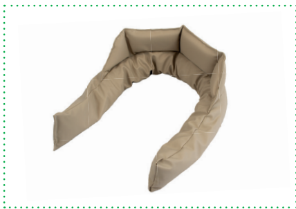
Bed Buddy Diana