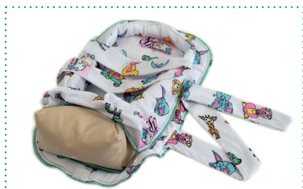
Baumwollbezug Cuddle Up Hug mit gepolsterter Fußrolle