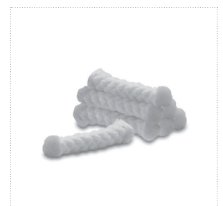
Saugeinlagen für Brustwarzenschutz