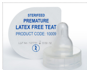
Sauger für Frühgeborene