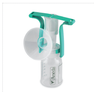
Einhandpumpe mit Flexishield™