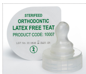
Sauger für Reifgeborene in kieferorthopädischer Form