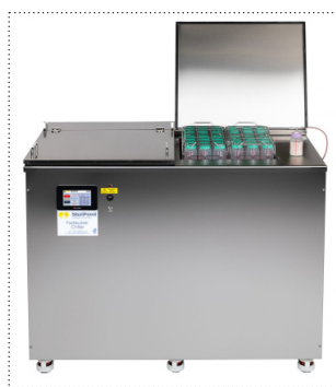
Vollautomatischer Pasteurisierer S180/USB