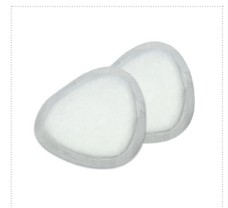
Stilleinlage NoShow Premium™

Die Einmal-Stilleinlagen NoShow Premium™ sind aus Hygienegründen einzeln verpackt. Dank der Einzelverpackung ist es möglich, die Einweg-Stilleinlage ohne Angst vor Verschmutzungen in jeder Hand- oder Wickeltasche mitzunehmen.