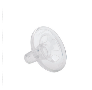
Flexishield™ Areola Stimulator