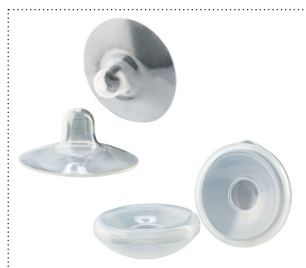
Brustwarzenschutz und Brustschalen

Die Brustglocken (auch Brusthauben genannt) sind in verschiedenen Größen erhältlich. Da alle Brüste unterschiedlich groß sind, bieten wir Ihnen auch eine große Auswahl von Brusthauben für die verschiedenen Bedürfnisse an. So können Sie Ihre perfekt sitzende Brustglocke wählen und profitieren von einem angenehmen Tragegefühl.