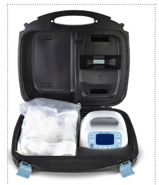
Aufbewahrungskoffer für Brustpumpe Pearl