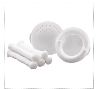
Brustwarzenschutz mit Saugeinlage