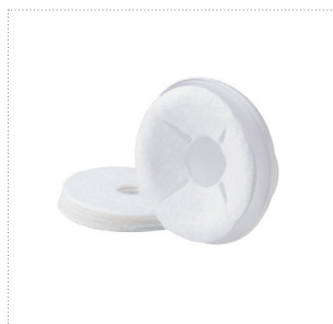
Brustwarzenformer mit Komforteinlage