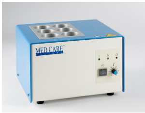
clinitherm® baby für 6 Flaschen