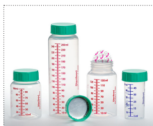
Flaschen mit Verschlussfoliensiegel