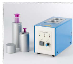
clinitherm® baby für 2 Flaschen und Beispiele für Reduziereinsätze