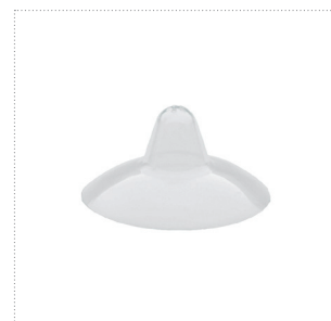
Brusthütchen, Größe 2