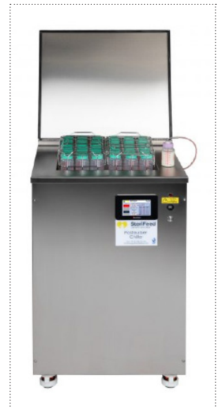
Vollautomatischer Pasteurisierer S90/USB