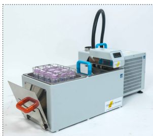
Halbautomatischer Pasteurierer T30