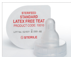
Sauger für Reifgeborene