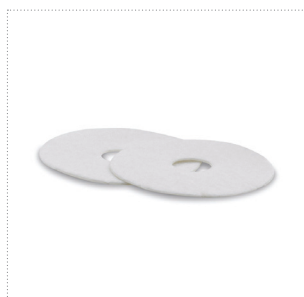
Komforteinlagen für Brustwarzenformer