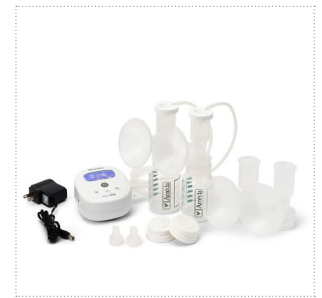
Milchpumpe Mya Joy

Ob beim Abpumpen unterwegs, zu Hause oder bei der Arbeit, Mya Joy bietet Abpumpen ohne Kompromisse mit ihrer reisefähigen Größe, die kompakt, leicht und tragbar ist.