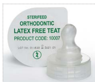
Sauger für Reifgeborene in kieferorthopädischer Form