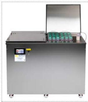
Vollautomatischer Pasteurisierer S180/USB