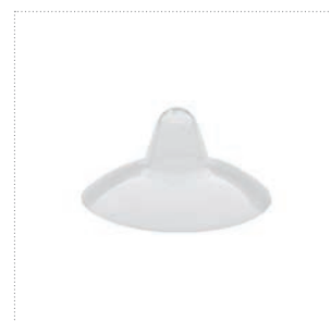
Brusthütchen, Größe 2