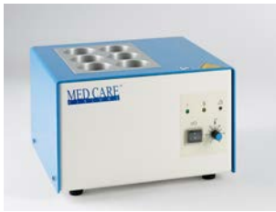
clinitherm® baby für 6 Flaschen