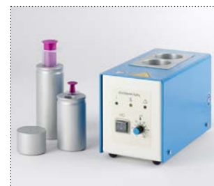
clinitherm® baby für 2 Flaschen und Beispiele für Reduziereinsätze