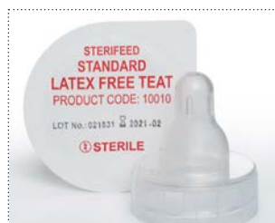
Sauger für Reifgeborene