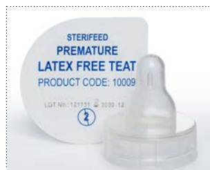
Sauger für Frühgeborene