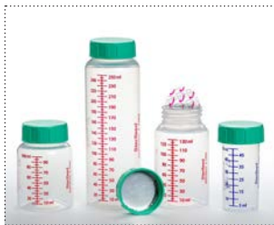
Flaschen mit Verschlussfoliensiegel