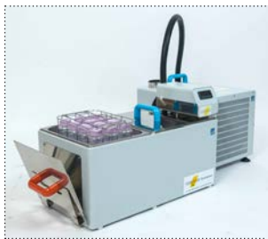
Halbautomatischer Pasteurierer T30